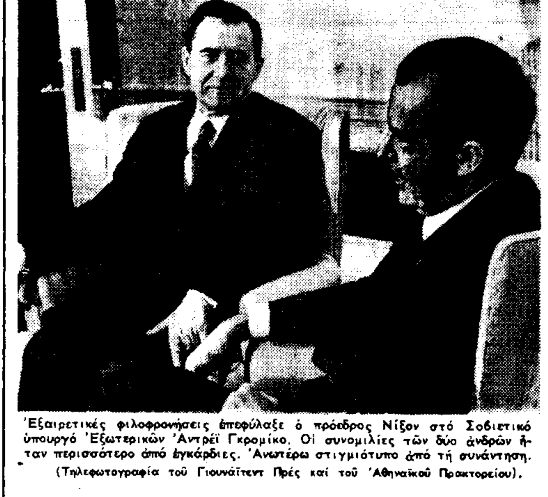
Εξαιρετικές φιλοφρονέσεις έπρωξίσε ο πρόεδρος Νίξον στό Σοβιετικό ύπουργό Έξωτερικών Άντρι Γκρομικό. Οι συνομιλίες τών δύο ανδρών ήσαν περισσότερο άπό έγκυρες...