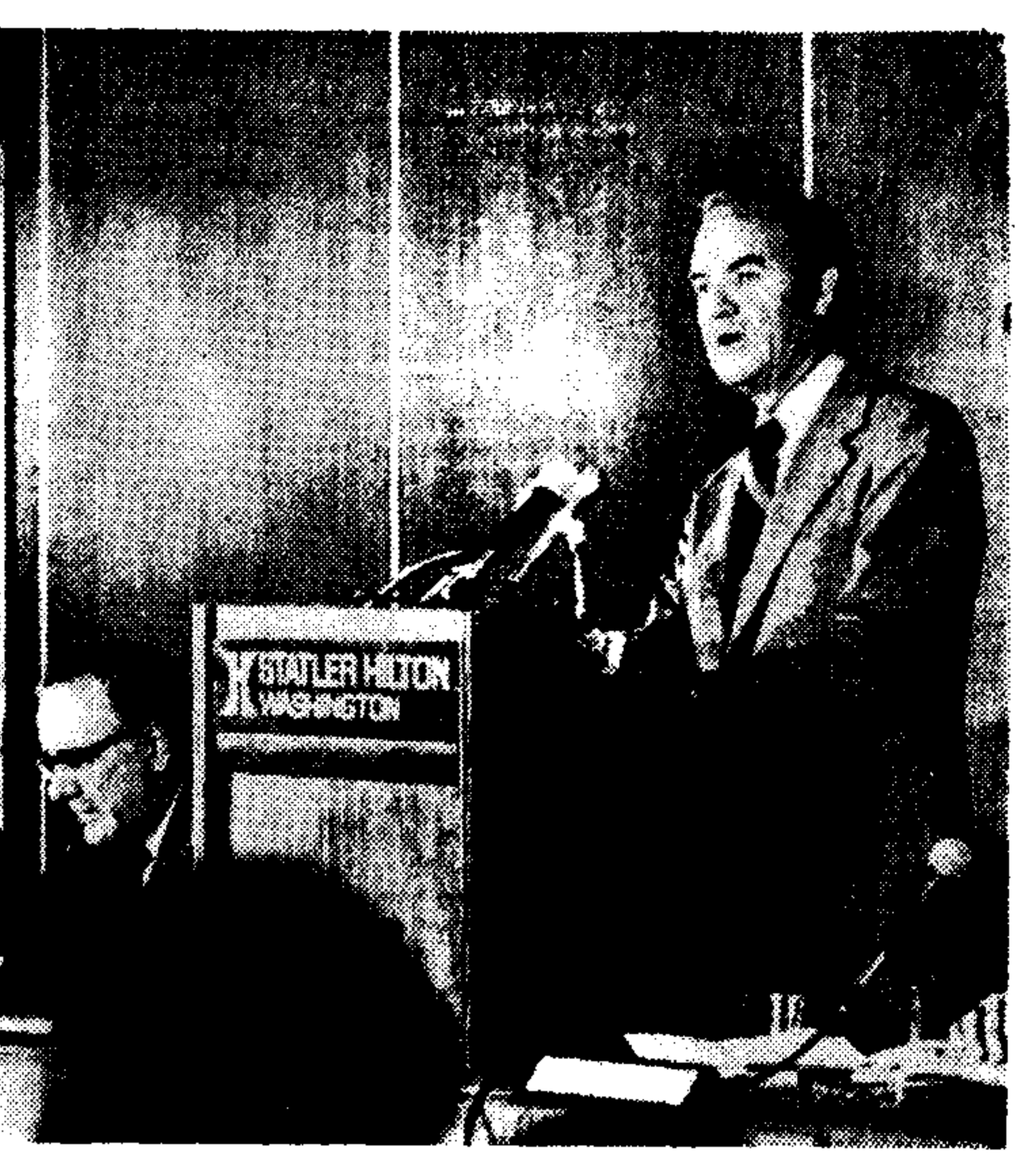
Ο δημοκρατικός ύποψήφιος για τήν προεδρία Τζωρτζ Μακγκόβερν, ένώ χαιρετίζει τόν συνέδριο τού ΥΡΙ στην Ουάσιγκτον.